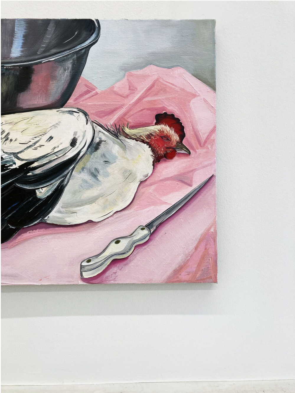
Close up | Nikki Maloof | Image credit @ Munchies Art Club

Avec son passé fastueux en matière d'Art Nouveau (on y compte près d'un millier de bâtiments de ce style dont les sublimes Musée Horta Hôtel Solvay), la capitale belge à seulement 1h30 de Paris en train, n'a jamais cessé de faire parler d'elle en matière de création.